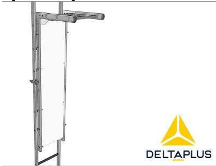
Figuur 3: Tekening afsluitbare deur koolladder.

Totaal Afsluitbare deur met deksel koolladder (excl. slot): € 643,88